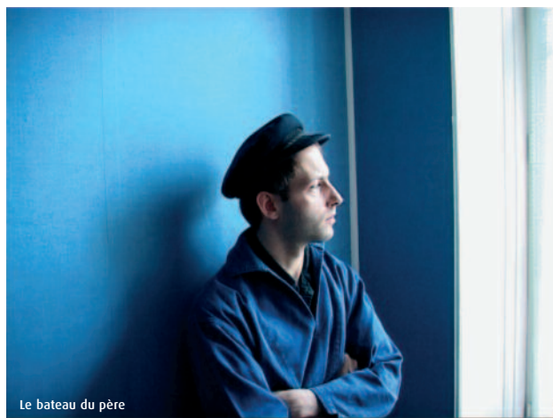
Le bateau du père