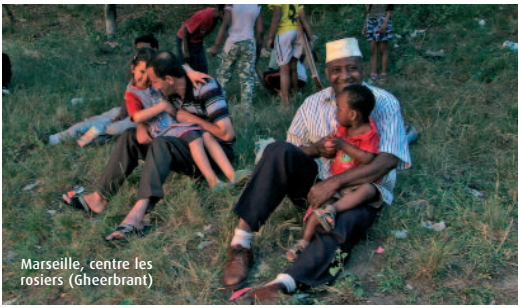
Marseille, centre les rosiers (Gheerbrant)

Très bonne année 2010, qu'elle vous soit riche en rencontres et découvertes !